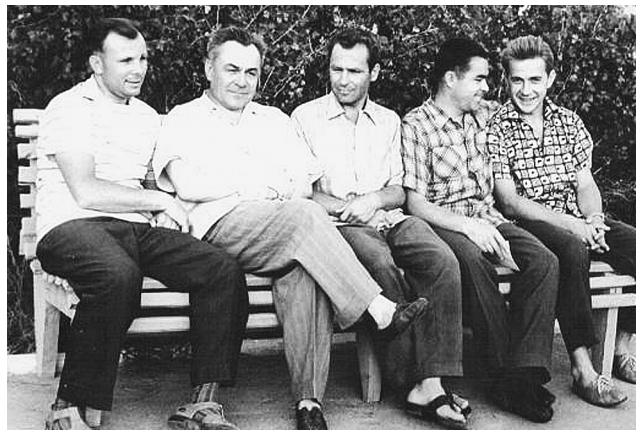
На снимке: С.П. Королёв (второй слева) и первая четверка космонавтов — Юрий Гагарин, Герман Титов, Андриан Николаев, Павел Попович.

Из закрытых страниц истории: Королев С.П. человек очень сложной судьбы. При жизни имя Королёва считалось секретным. Оно не упоминалось ни в новостях при запуске Спутника, ни при полёте Гагарина. Королёв — единственный человек в истории СССР, получивший звание Героя Социалистического Труда, не будучи реабилитированным (звание присвоено 20.04.1956 г., а реабилитирован 18.04.1957 г.). Советская пропаганда говорила о нём как о гениальном учёном, основоположнике космонавтики, но замалчивала факт его ареста. Возвращаясь с Кольмы в Москву, в Магадане Королёв не попал на пароход «Инди-гирка» (по причине занятости всех мест). Это спасло ему жизнь: следую из Магадана во Владивосток пароход «Инди-гирка» попал в шторм и затонул у острова Хоккайдо.